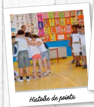
Histoire de points