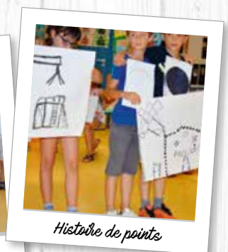
Histoire de points