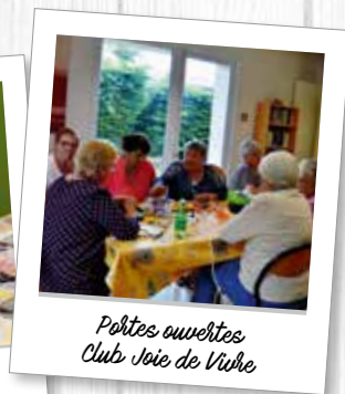
Portes ouvertes Club Joie de Vivre