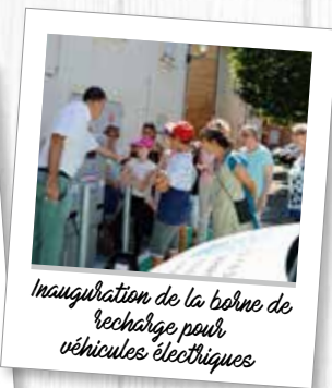
Inauguration de la borne de recharge pour véhicules électriques