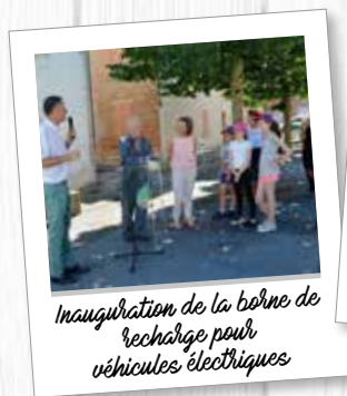
Inauguration de la borne de recharge pour véhicules électriques