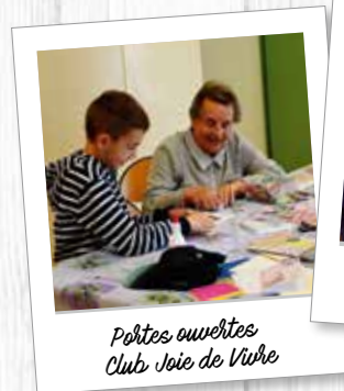
Portes ouvertes Club Joie de Vivre