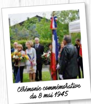
Cérémonie commémorative du 8 mai 1945