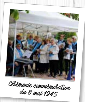
Cérémonie commémorative du 8 mai 1945