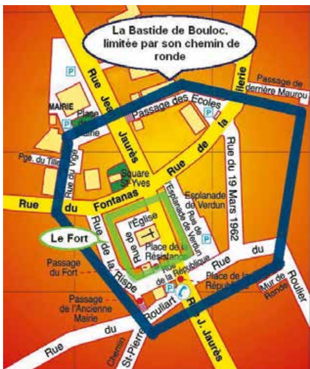
Vision de la bastide en 2018 (plan Mairie et Google)

En théorie, une bastide est une ville neuve construite de toutes pièces dans un espace nouvellement défriché. Ce n'est pas le cas de notre village qui s'enroule autour d'un bourg déjà installé: Le Fort. C'est ce qu'on appelle: une bastide à enveloppement .