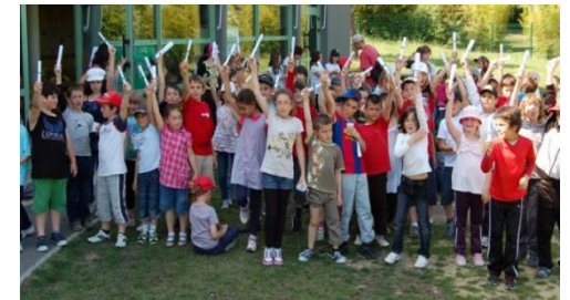
Accueil de Loisirs Sans Hébergement (ALSH)