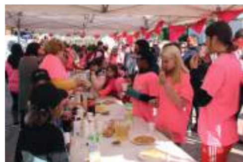
Pot de l'amitié offert par la municipalité