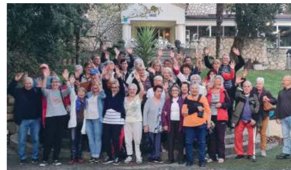
Les bénéficiaires ravis par leur séjour d'automne