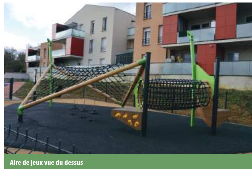
Aire de jeu vue du dessus

Cette parcelle sera rétrocédée prochainement à la municipalité.