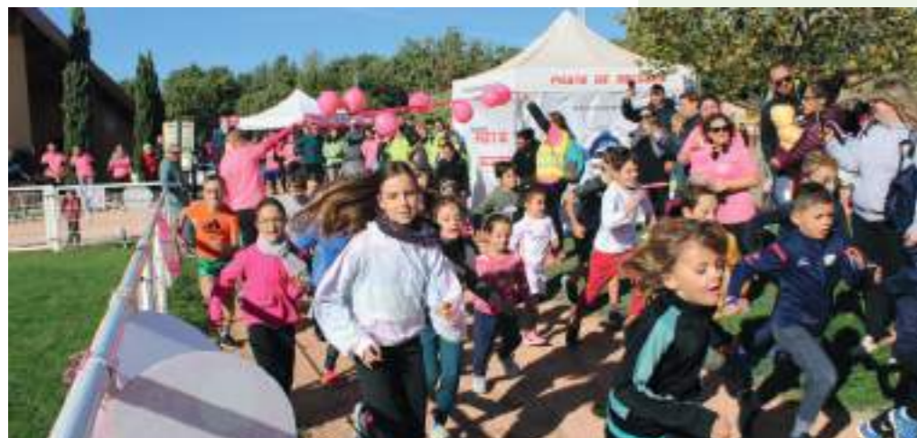
La course des enfants

Près de 350 personnes ont participé à la manifestation solidaire La Belle Rose. Dès 6 h 00, les bénévoles ont installé le « village départ » au complexe sportif. Équipés du traditionnel t-shirt rose, ils étaient présents sur l'ensemble des deux parcours pour ravitailler et veiller au bon déroulement des épreuves. L'air frais automnal n'a pas découragé les marcheurs, randonneurs et coureurs. Peu avant 10 h 30, les premiers ont franchi la ligne d'arrivée sous les applaudissements des spectateurs. Les jeunes du Centre d'Action Jeunesse ont remis à chaque participant un cadeau offert par la Région. Sur le terrain d'honneur, les jeunes sportifs se sont échauffés comme les grands sous l'impulsion du coach du BAG. Plusieurs associations étaient présentes