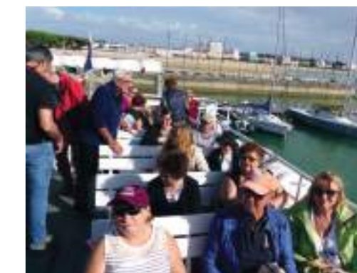
Escale au Phare de Courdouan

Tarif pour 8 jours/7 nuits : 410€ sans aide - 230€ avec la subvention