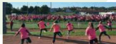
Échauffement mené par les coaches du BAG