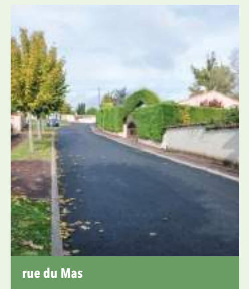
rue du Mas