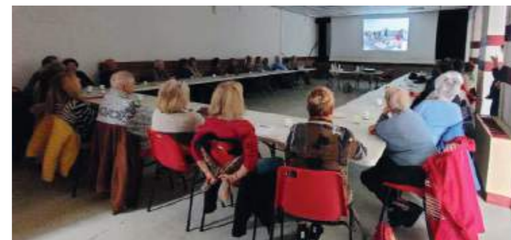
Bilan du voyage à Saint-Georges de Didonne