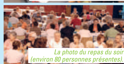
La photo du repas du soir (environ 80 personnes présentes).