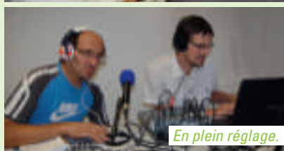
En plein réglage.