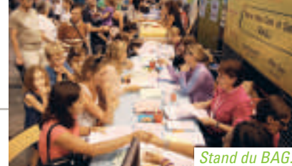
Stand du BAG.

Comme l'an dernier, la Municipalité avait choisi d'organiser son traditionnel Forum des Associations juste avant la rentrée pour éviter qu'il n'ait lieu en même temps que celui de toutes les autres communes avoisinantes. Au vu de l'affluence, samedi 1 er septembre, les associations (39 étaient présentes), comment l'ensemble des habitants, semblent apprécier la démarche. Entre 14 h 00 et 18 h 00, enfants et parents sont venus à la rencontre des clubs, associations et autres comités pour se renseigner, découvrir ou encore s'inscrire. Tout l'après-midi, de nombreuses démonstrations ont eu lieu. Sur les coups de 19 h 00, la Municipalité a offert un apéritif de clôture puis une centaine de personnes a pris part au buffet froid que la commission « Sport, Culture, Loisir et Communication » avait préparé pour terminer cette belle journée. ●