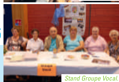
Stand Groupe Vocal.