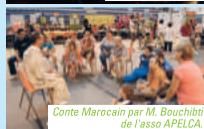
Conte Marocain par M. Bouchibti de l'asso APELCA.