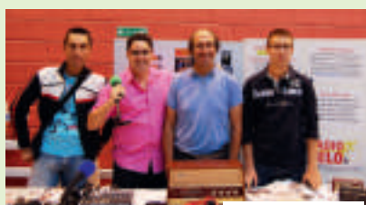
Stand au forum.